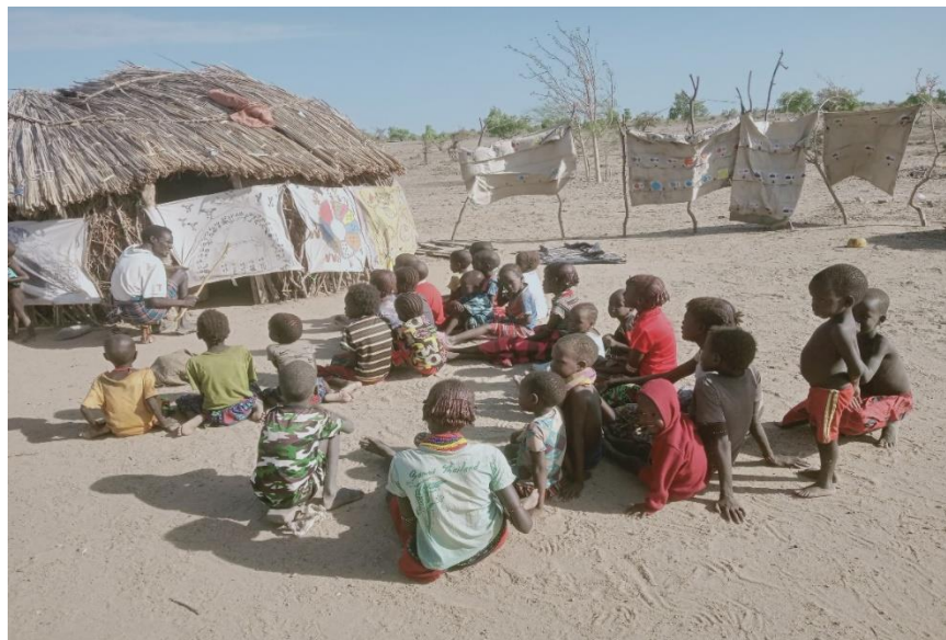
Mr. Kong'odo Mobile Schule in Dharim. 1

Wir sehen zunehmend die positiven Auswirkungen, die unser Bildungssystem auf das Leben der Daasanach hat. Aber wie Sie sich vorstellen können, ist es in Bezug auf die Zahlen, um die es geht, noch ein sehr langer Weg. Wir haben jetzt etwa 600 Kinder im Alter von 7 bis 14 Jahren, die in unseren 20 Schulen eingeschrieben sind. Die neuen Lehrer, die im letz-